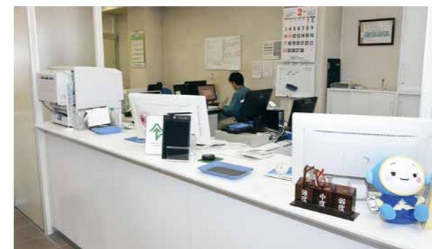
▲開設する上下水道お客さまセンター窓口の様子

万が一ご不審な点がありましたら、身分証明書の提示を求めるかお客さまセンターまでご確認ください。