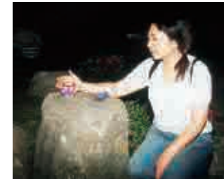
▲100万人のキャンドルナイトに参加

代表的な事業としては、「わんぱく相撲仙南場所」です。平成9年に白石市を会場として、全国の城下町にある青年会議所が一堂に会して、「全国城下町シンポジウム」が開催された際に、記念事業としたことをきっかけに毎年開催しており、今年で9回目となります。