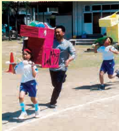
▲親子でかけっこ「白川ダービー」