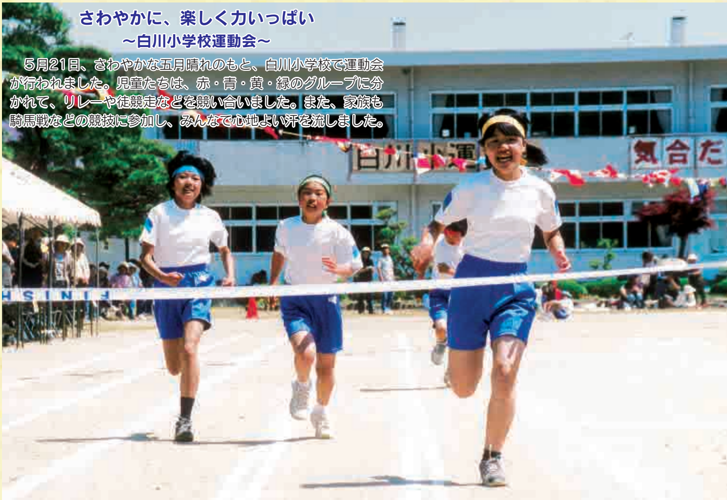
▲見事一着でゴール!

5月21日、さわやかな五月晴れのもと、白川小学校で運動会が行われました。児童たちは、赤・青・黄・緑のグループに分かれて、リレーや徒競走などを競い合いました。また、家族も騎馬戦などの競技に参加し、みんなで心地よい汗を流しました。