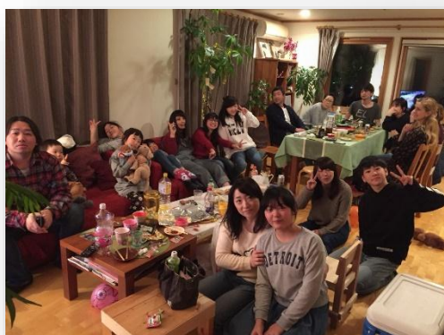
▲大晦日のホームパーティ～(^^♪