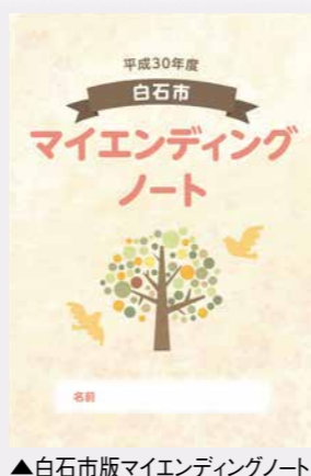
▲白石市版マイエディングノート