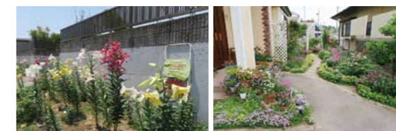
▲フォトブックに掲載されている写真