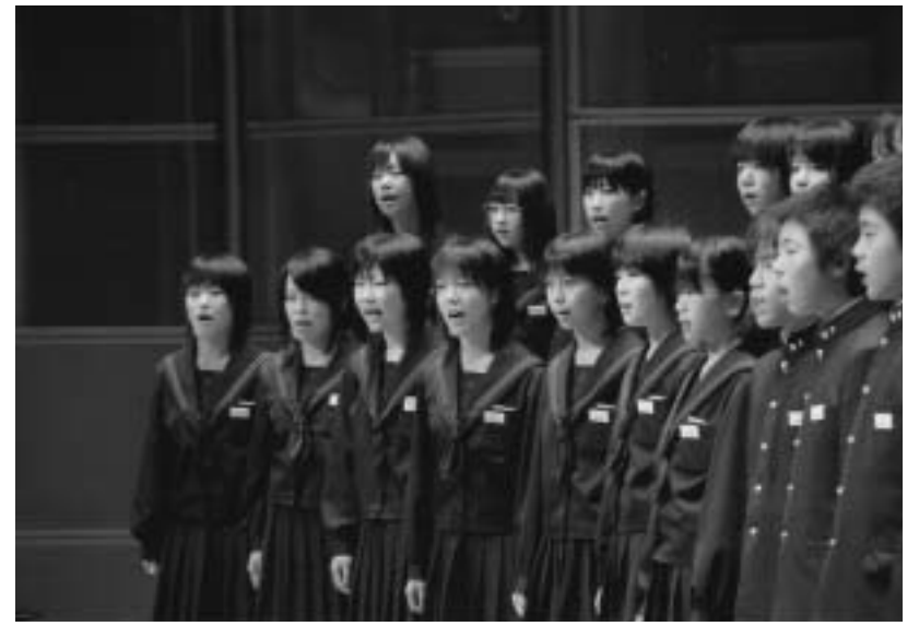
平成16年度校内合唱コンクール