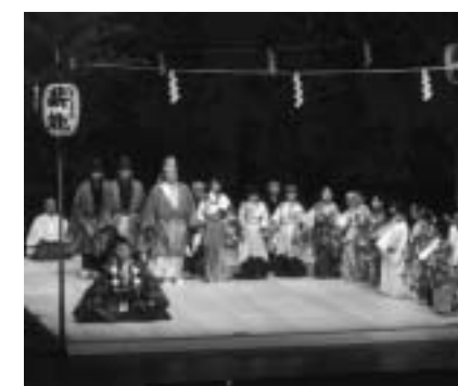
▲よこすか薪能「鞍馬天狗」(平成14年8月)