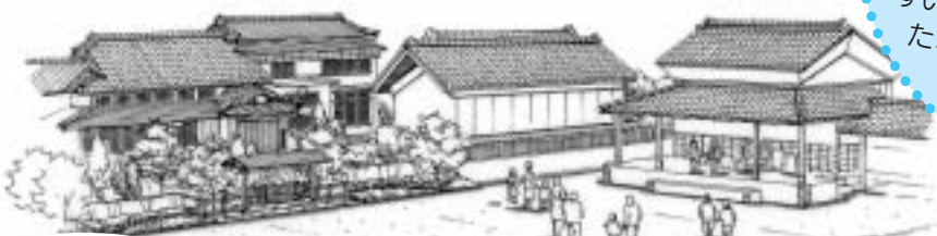
◀すまいる広場完成予想図

広場の名称は、市民の皆さんから名称を募って選考した結果、「壽丸屋敷の名を残しながら親しみやすい名前に」と応募いただいた、「すまいる広場」に決定したものです。