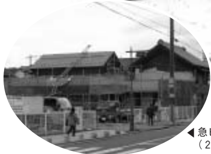
◀急ピッチで工事の進むすまいる広場(2月10日撮影)