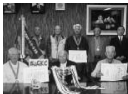
▲郡山GKCチームの皆さん