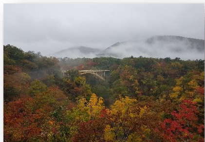
▲紅葉の時期に鳴子峡へ（初の温泉旅行）

Hello everyone, Another month in Japan and many more adventures and memories made. This is going to be last Whitestone Journal and it is with both happiness and sadness that I write this. Happiness because of all the great memorable moments that I was reflecting upon that I was lucky enough to experience, and sadness, for realising that I won't be living in Shiroishi and Japan for much longer!