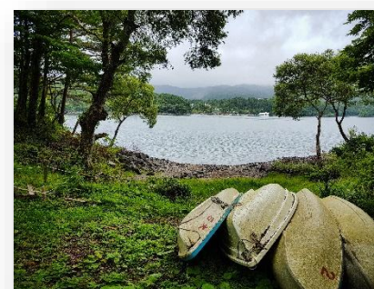
▲磐梯湖に2回行きました。

Having lived in Shiroishi now for nearly a year, I can happily say that I have really loved my time here. From my first few weeks here, I was surprised at the kindness and the hospitality of many people I had met. Many people were excited and eager to learn more about me and Australia, and that made my transition living in another country quite smooth. I have made many friends and relationships through my involvements in Japanese tea ceremony, sporting clubs, joining many work-parties, attending festivals and events which were run throughout the city and more! I was also lucky to have gone for a homestay with a local family - which really gave me a great insight into how Japanese people go about their daily lives and of course building great relationships at the same time. The friendly and welcoming people of Shiroishi was definitely was one of the biggest reasons why I have loved my time here.