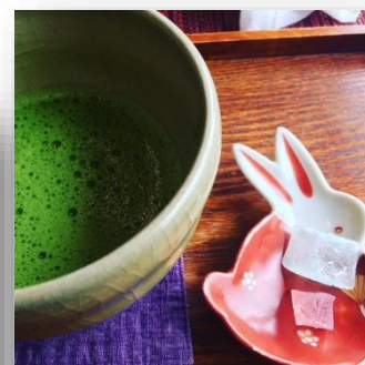
▲お気に入りのお茶屋さん (京都・清水寺近く)