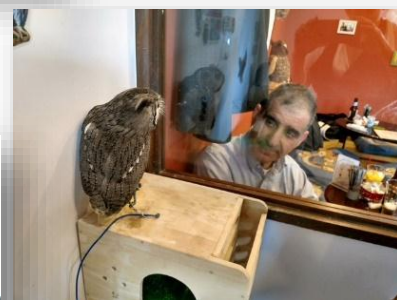
▲ダディです・・・(^)/ @東京・原宿のふくろうカフェ