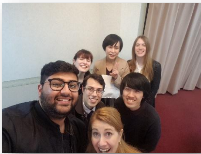
▲白石市 ALT の仲間と市教委の方と！

Other than the people and the students, I have loved exploring Japan! Japan is so amazingly beautiful that it is quite hard to put into words. I very much loved the scenery that each season would bring - the contrasts were so strikingly beautiful. I feel so lucky to have explored so many places around Miyagi and the nearby Tohoku area. Shiroishi is located in a beautiful part of Miyagi, with amazing views of Mt. Zao and the mountains. It's a small country-side city that has everything that you need, but at the same time is close to the bigger areas like Sendai and even Tokyo with the bullet trains. It's so close to Fukushima, Yamagata and even Iwate which was great because I got to try lots of unique foods and visit many onsens, which became one of my favourite hobbies. I tried to make the most of my limited time here so I tried to do explore a new area pretty much every weekend - which although was very fun but unfortunately has made me very poor haha! But, no regrets! :)