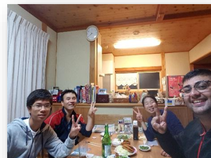
• ホームステイ体験！ホストファミリーと…(〜♪)▲

It also helps if your daily job is fun, and by being an ALT in Shiroishi JHS, Higashi JHS and Daini ES - it was always a joy! I personally love spending time with kids and having fun! My style of teaching is easy-going but engaging, with the hope that it would generate natural interest for the kids to learn English and also in other cultures like Australia. I really wanted to build good relationships with my students, and I think I have been able to do so in my time here! The students in all the schools have been fantastic and I looked forward to going to school every day because of the students. So, I am definitely going to miss this when I go back home! :(