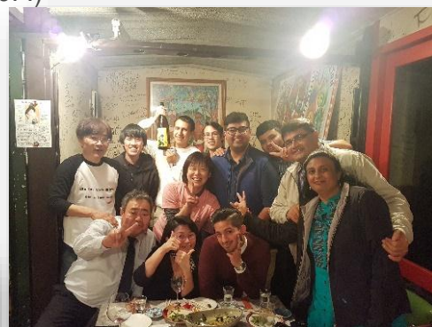
▲このお店での美味しい料理・お酒、楽しい会話は忘れられないな。家族が白石に来たときに仲間と一緒に～(^_^)