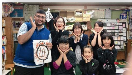
▲書道?にも挑戦（亀を描いたよ〜♪）@市内書道塾

I had wanted to come to Japan for a long time. I was inspired by my Geography teacher when I was in Year 10 to travel and live abroad. My geography teacher would often share his daughter's experiences when she was living in Japan - and something about that made a lasting impression on me from a young age. Japan also always has had this charm about it that made me want to come one day. Like many other foreigners and ALT's, I wasn't interested in any of the manga, anime or other Japanese pop culture. I didn't even speak a word of Japanese before arriving. I really didn't know much about Japan other than the delicious foods because we have lots of Japanese restaurants in Australia.