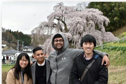
▲小旅行。桜名所のひとつ、福島の上春滝桜でお花見～

Other than the people and the students, I have loved exploring Japan! Japan is so amazingly beautiful that it is quite hard to put into words. I very much loved the scenery that each season would bring - the contrasts were so strikingly beautiful. I feel so lucky to have explored so many places around Miyagi and the nearby Tohoku area. Shiroishi is located in a beautiful part of Miyagi, with amazing views of Mt. Zao and the mountains. It's a small country-side city that has everything that you need, but at the same time is close to the bigger areas like Sendai and even Tokyo with the bullet trains. It's so close to Fukushima, Yamagata and even Iwate which was great because I got to try lots of unique foods and visit many onsens, which became one of my favourite hobbies. I tried to make the most of my limited time here so I tried to do explore a new area pretty much every weekend - which although was very fun but unfortunately has made me very poor haha! But, no regrets! :)