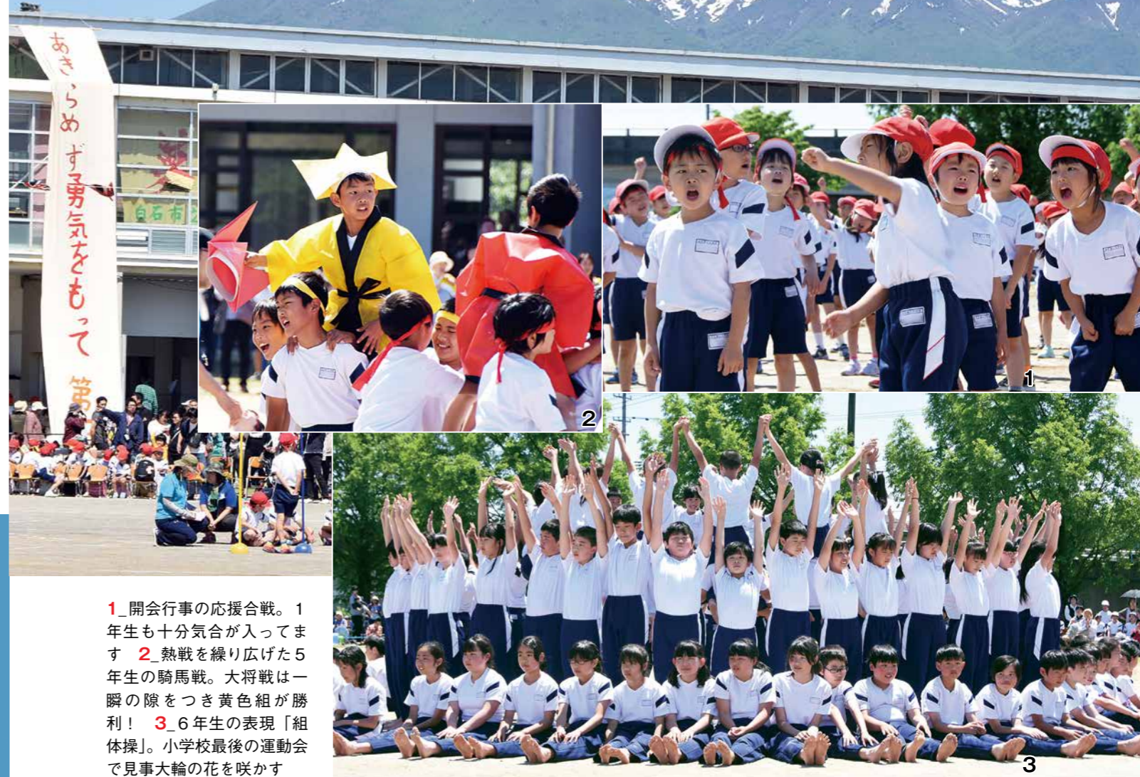
1_開会行事の応援合戦。1年生も十分気が入ってます 2_熱戦を繰り広げた5年生の騎馬戦。大将戦は一瞬の隙をつき黄色組が勝利! 3_6年生の表現「組体操」。小学校最後の運動会で見事大輪の花を咲かす