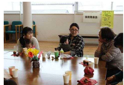
事例発表会でのファミサポカフェの様子