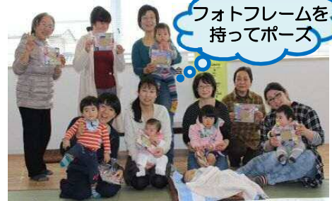
フォトフレームを持ってポーズ