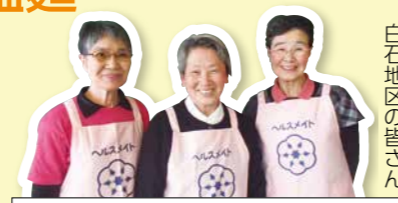
白石地区の皆さん

*ゆでた枝豆や絹さやは、早めに混ぜると色が変わるので、上に乗せても彩りがきれいです。