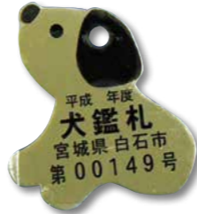
鑑札は必ず持参してください