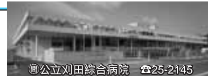
公立刈田総合病院 ☎25-2145