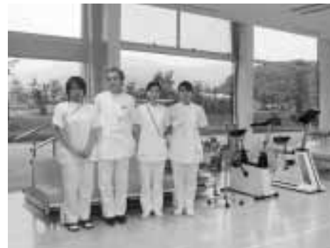
船渡リハビリテーション科部長以下、リハビリテーション科スタッフの皆さん

主な治療は、寝返り・起き上がり起居動作や歩行などの基本動作訓練を行う「理学療法」と、食事や着替え、排泄などの具体的な日常生活動作訓練を行う「作業療法」です。自然と人工のあやなす楽しい散歩道を備えた「リハビリガーデン」、最新鋭の機器をそろえ、明るく開放感にあふれた室内と、快適な環境で訓練治療を行っています。