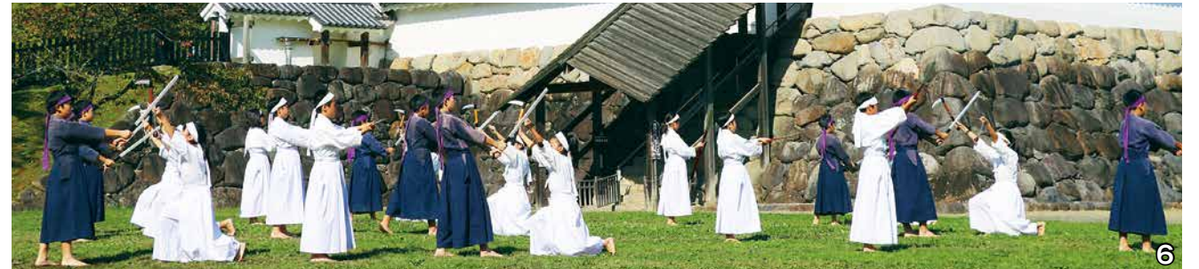
1_引き継ぎ式で6年生に衣装の着付けを手伝ってもらう4年生 2・6_昨年10月24日に行われた「宮城野信夫物語」の撮影には、5・6年生が参加。現代に伝承される団七踊りを白石城本丸広場で再現! 4月から歴史探訪ミュージアムでも上映される 3_代々使用してきた刀や鎖がまも引き継がれる 4_気持ちのこもった6年生の最後の団七踊り 5_6年生の演技披露を受けて真剣な表情で踊る5年生