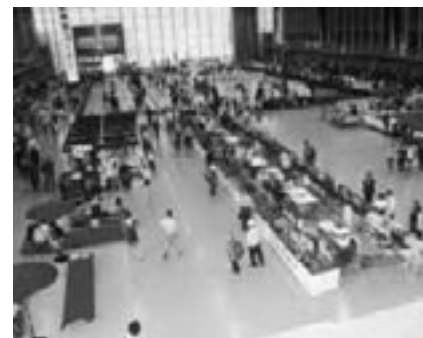
▲レイアウトを一新した会場

5月3日から5日までの3日間、全日本こけしコンクールがホワイトキューブで開催されました。今年の出品数は1022点。工人たちの伝統の継承や近代的な美を競った力作が並びました。子どもたちにも親しまれるコンクールにと、鉄道模型やゲーム機のコーナーを設けたのははじめ、各種イベントも盛りだくさんで、市内外から6万2千人もの人たちがコンクールに訪れました。