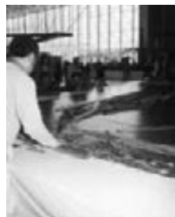
▲子どもたちに大人気だった鉄道模型コーナー

5月3日から5日までの3日間、全日本こけしコンクールがホワイトキューブで開催されました。今年の出品数は1022点。工人たちの伝統の継承や近代的な美を競った力作が並びました。子どもたちにも親しまれるコンクールにと、鉄道模型やゲーム機のコーナーを設けたのははじめ、各種イベントも盛りだくさんで、市内外から6万2千人もの人たちがコンクールに訪れました。