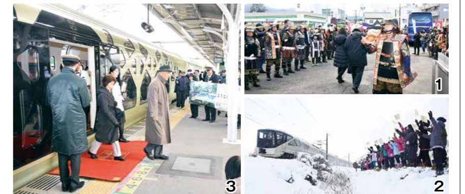
1_甲冑武者姿の「おもてなし隊」や小旗を手にした市民がお出迎え 2_12月12日、越河小学校の児童など約50人が雪の中の沿線でおもてなし 3_最初の停車駅・白石駅に降りる乗客

白石駅で歓迎を受けた乗客は、「盛大なお出迎えを受けて感激しました。訪れる土地で観光を楽しみたいです」と話していました。